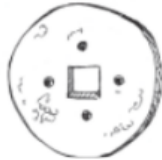
PEDRA DO MOINHO