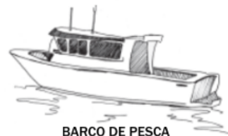
BARCO DE PESCA