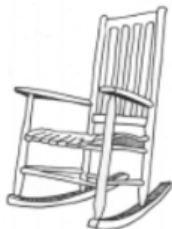
CADEIRA DE BALANÇO