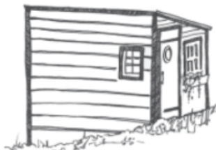
CABANA DE VIEIRAS